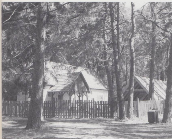
Erdőn, mezőn, úttalan utakon

A kezdeményezés érdeme elsősorban a Zsámbéki-medence Idegenforgalmi Egyesületé, amely vállalta, hogy megkeresi és