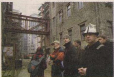
Akiknek nem térték e táj