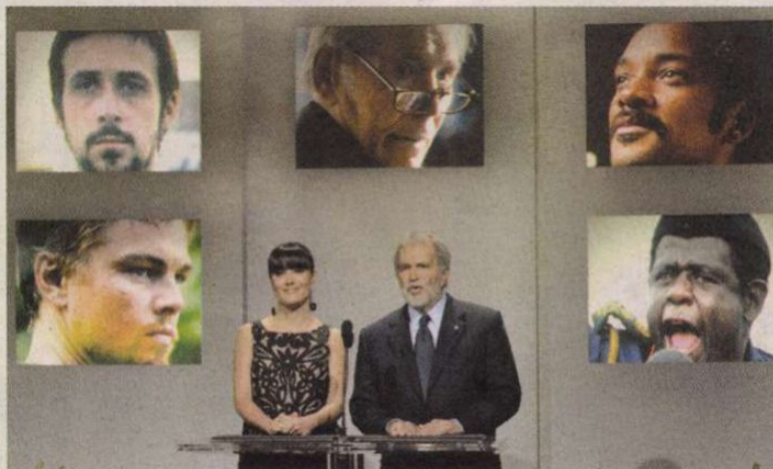
Salma Hayek és Sid Ganis, a filmakadémia elnöke

A legjobb mellékszereplő jelöltjei között szerepel a férfiaknál mások