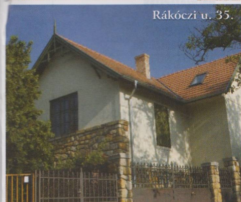
Rákóczi u. 35.