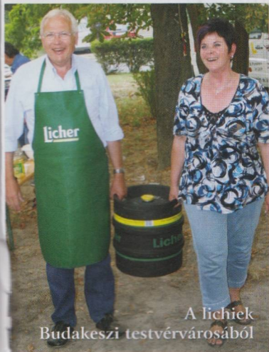
A lichiek Budakeszi testvérvárosából