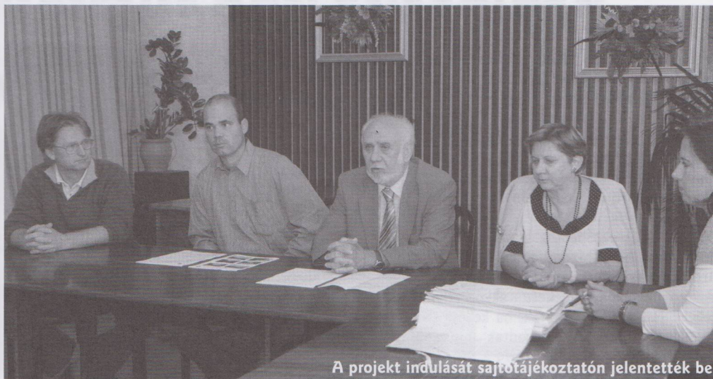
A projekt indulását sajtótájékoztatón jelentették be

Budakeszi Város Önkormányzata és a Pro Regio Közép Magyarországi Regionális Fejlesztési és Szolgáltató Nonprofit Közhasznú Kft. 2009. április 28-án írták alá a támogatási szerződést, és a szükséges közbeszerzési eljárások lefolytatása után a Penta Általános