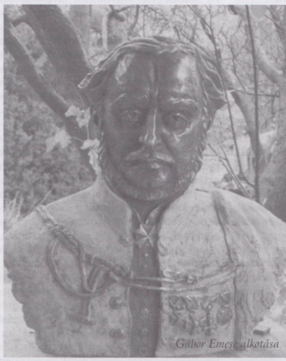
Gábor Emese alkotása

ne az igényes városépítő és egyben közösségteremtő tevékenységnek. A szobor felavatását 2010. április 7-én szerdán 17 órakor ünnepség keretében rendezzük a Budakeszi Önkormányzattal együttműködve.