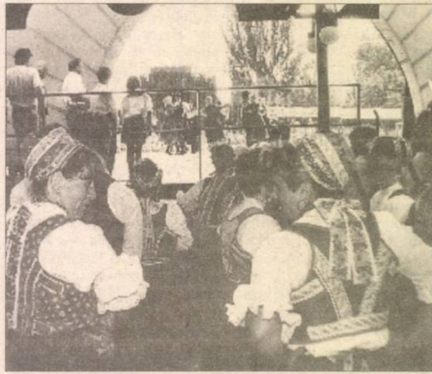
Fellépés előtt. Szakmai megbeszélés, vagy csak a napi gondokról esik szó?