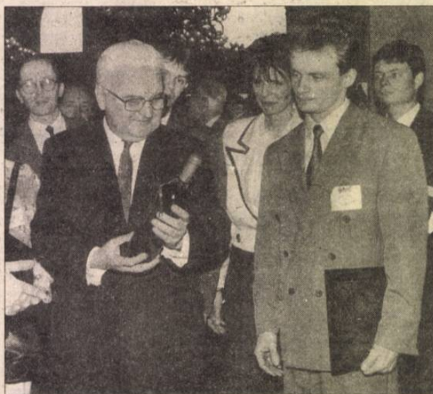
Boross Péter miniszterelnök a pesti Vigadóban a kiállítást is megtekintette

Sikeresek voltak a világiállításához kapcsolódó rendezvények pályázatai — összegezte az eddigi tapasztalatokat Barsiné Pataky Etelka, az expó főbiztosa a konferencián. — Emellett többen is jelezték, hogy különböző okokból lemaradtak erről. Ezért az expó főbiztosa megígérte, javasolni fogják, hogy március 31-ig