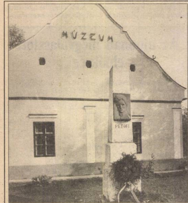
Petőfi-emlékoszlop és -dombormű a penci múzeum épülete előtt

Monteverdi Kamarakórus. Ezt követően Mádl Ferenc művelődési és közoktatási miniszter megnyitja a Csontváry-kiállítást, valamint a 24. nemzetközi éremművészeti tárlatot. (Színhely: a Magyar Nemzeti Galéria „A” épülete a Budai Várban.)