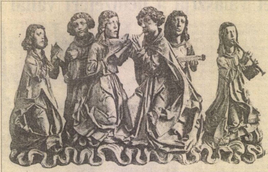
Tilman Riemenschneider: Koncert (féldombormű)