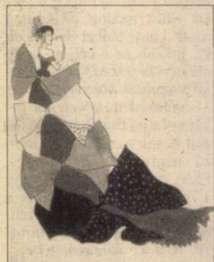
Az Ifjú lordhoz készített jelmezek egyike (b-i)

Főiskola őrzi a művész alkotásainak gazdag gyűjteményét, s ebből közel 300 alkotást válogattak ki a budapesti kiállításra. Selyem-applikációk, gobelinek, hímzések, paravánok, függönyök, képek, Helena Rubinstein és a Demel cukrászda számára készült díszpapírok, szövetminták, divat-, bútor- és szőnyegtervek kerülnek bemutatásra. A főiskola gyűjteményét az Ifjú lord című operához készített 8 darab jelmez, valamint a párizsi világkiállításra (1937) tervezett Augarten-porcelánok egészítik ki.