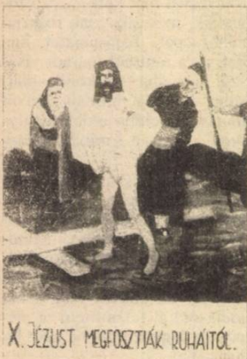
X. JÉZUST MEGFOSZTIÁK RUHÁITÓL