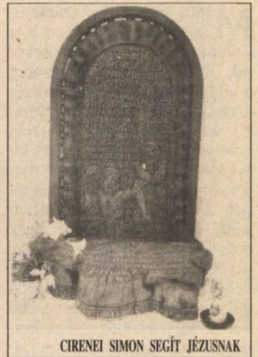
CIRENEI SIMON SEGÍT JÉZUSNAK