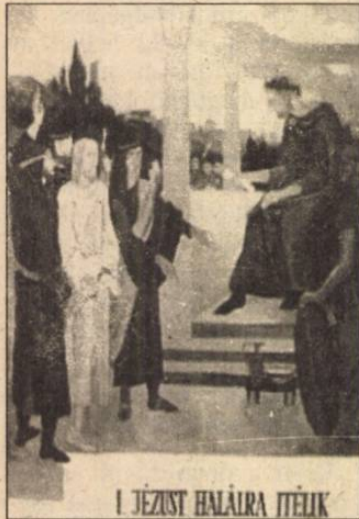
I. JÉZUST HALÁLRA ÍTÉLIK