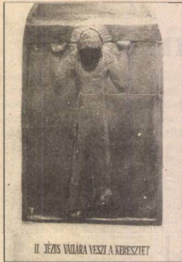
II. JÉZUS VÁDÁRA VESZI A KERESZTET