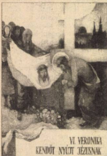
VI. VERONIKA KENDŐT NYÚJT JÉZUSNAK