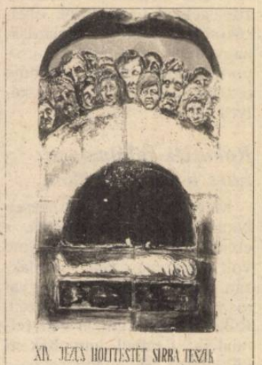
XIV. JÉZUS HOLTTESTÉT SÍRBA TESZIK