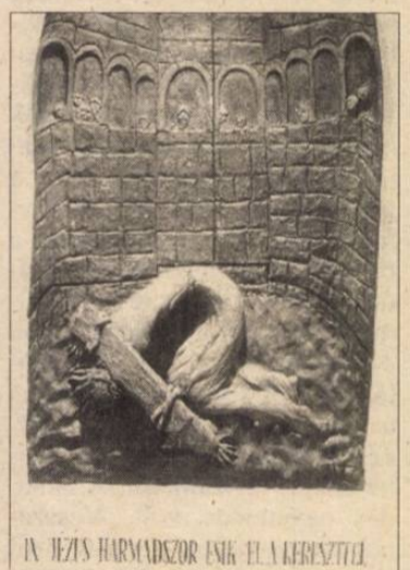
IX. JÉZUS HARMADSZOR ESİK EL A KERESZTTEL