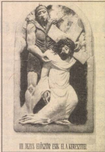
III. JÉZUS ELŐSZÖR ESİK EL A KERESZTTEL