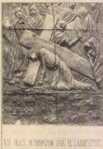
VII. JÉZUS MINDSZÖR ESİK EL A KERESZTTEL