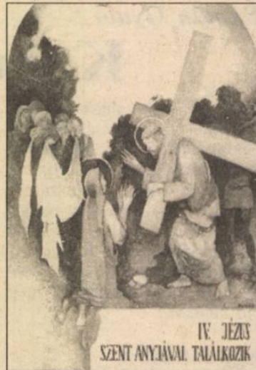
IV. JÉZUS SZENT ANYJÁVAL TALÁIKOZIK