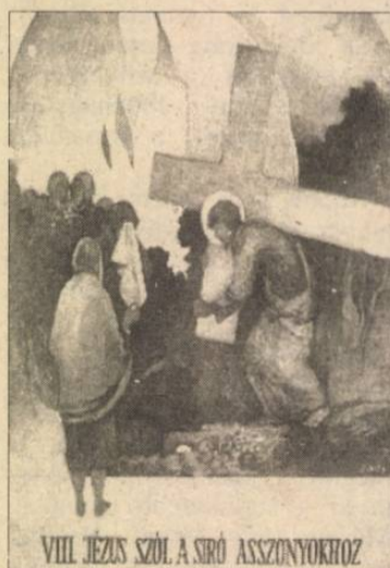
VIII. JÉZUS SZÓL A SÍRÓ ASSZONYOKHOZ