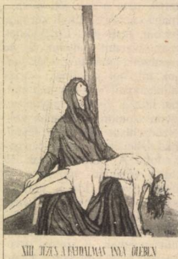
XIII. JÉZUS A FÁJDALMAS ANNA ÖLEBEN