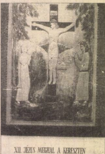
XII. JÉZUS MEGHAL A KERESZTEN