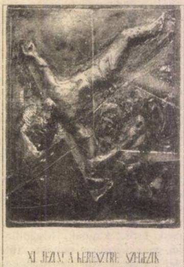
XI. JÉZUS A KERESZTRE SZEGYÉZIK