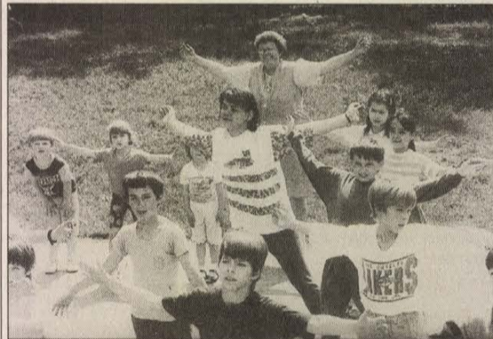
Vidáman tornázott a település apraja-nagyja Budakeszin

II. osztály. Északi csoport: Nagymaros-Törökbalint (Zágráb), Pilisszentiván-Szokolya