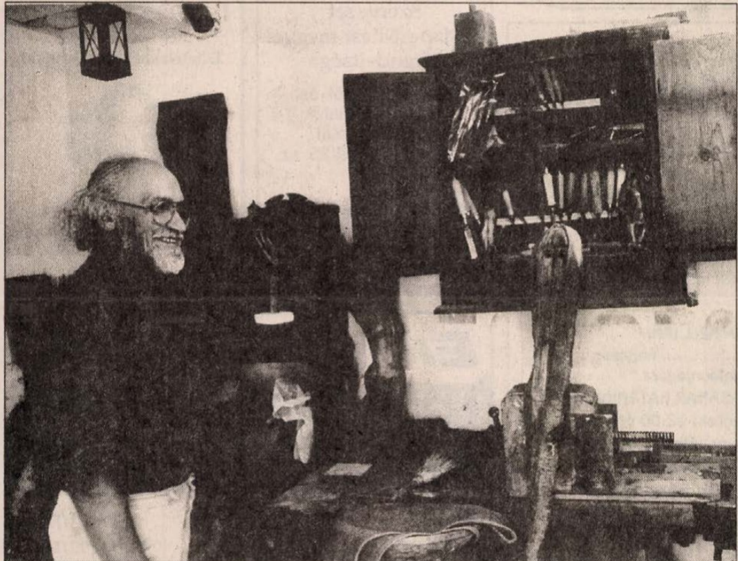
A zsámbéki mester műhelyében