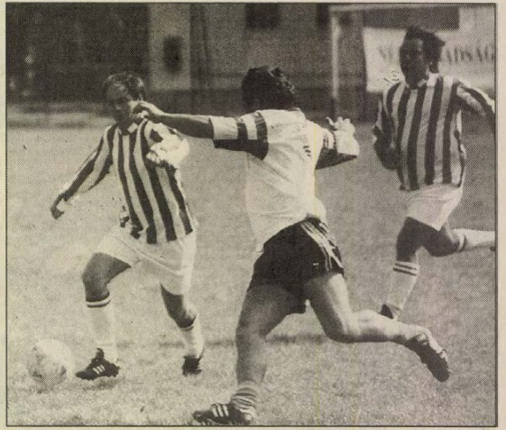
A Kismaros-Balatonfenyves (5-0) mérkőzésen a csikos mezés hazaiak hengereltek