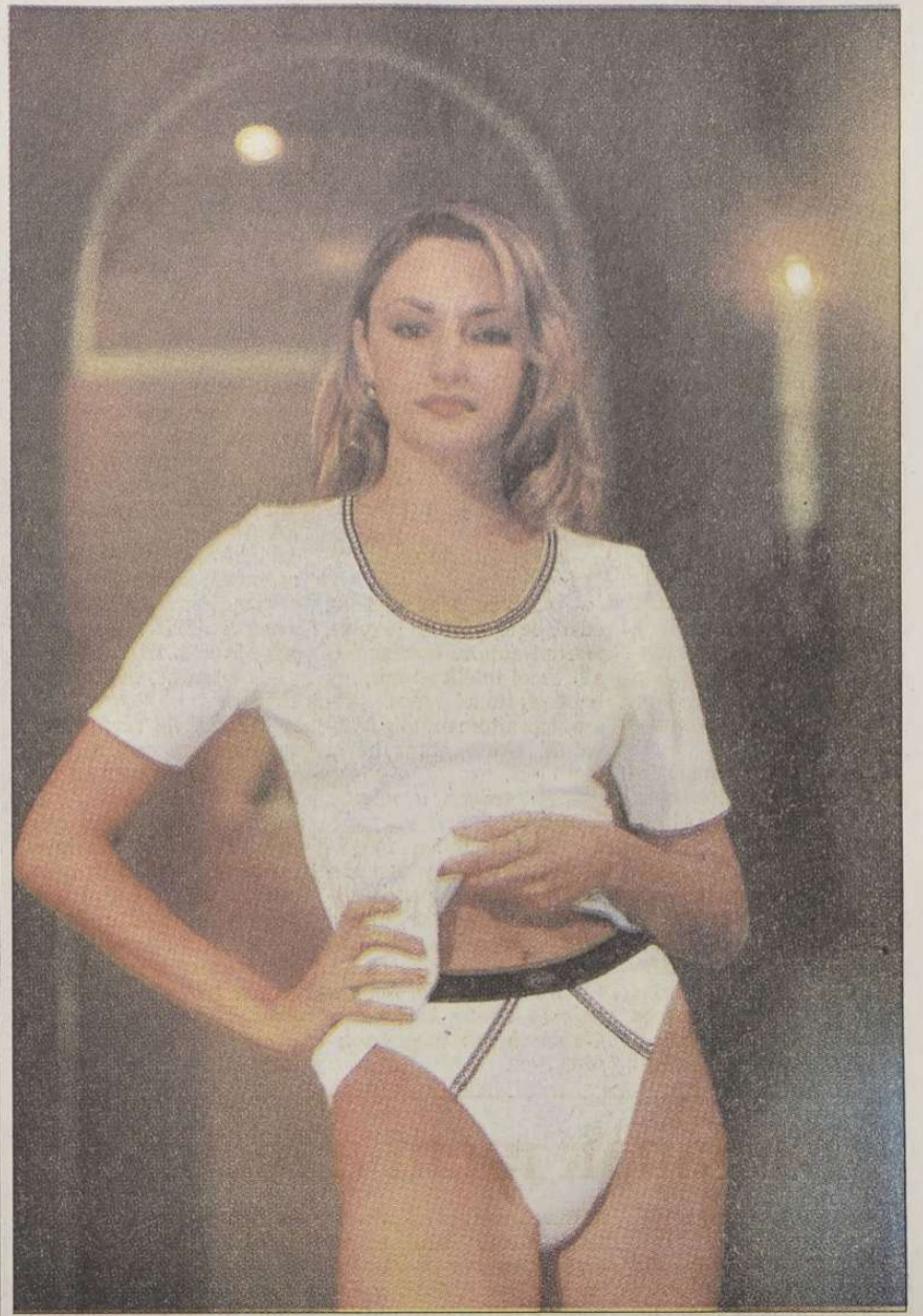
Az idén is a fehér az intim ruhadarabok legkedveltebb színe. A divattervezők gazdagon alkalmazott elasztikus csipkével emelik ki a vonalakat, rejtik el a takarni valót. A fehér mellett kedvelt a fekete és hódít a kék három árnyalata, a kobaltkék, az ultramarin és a királykék.