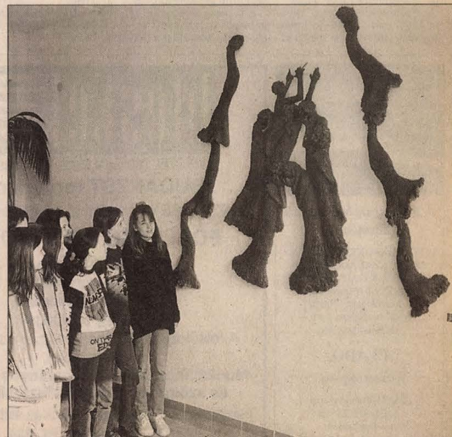
Az általános iskola új kerámia domborműve

(Az 1848/49-es forradalom és szabadságharcról szóló összeállításunk a 36-37. oldalon)