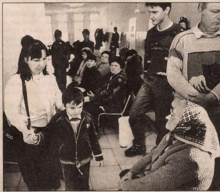
Hosszú a sor a nagykátai rendelőben

A prevencióval foglalkozó szervezetek - pályázati úton szerzett pénzekből - a szakemberek továbbképzésével, valamint rendezvényekkel, az iskolákban és a felnőtt lakosságnak szóló programokkal segítik az egészségnevelés ügyét.