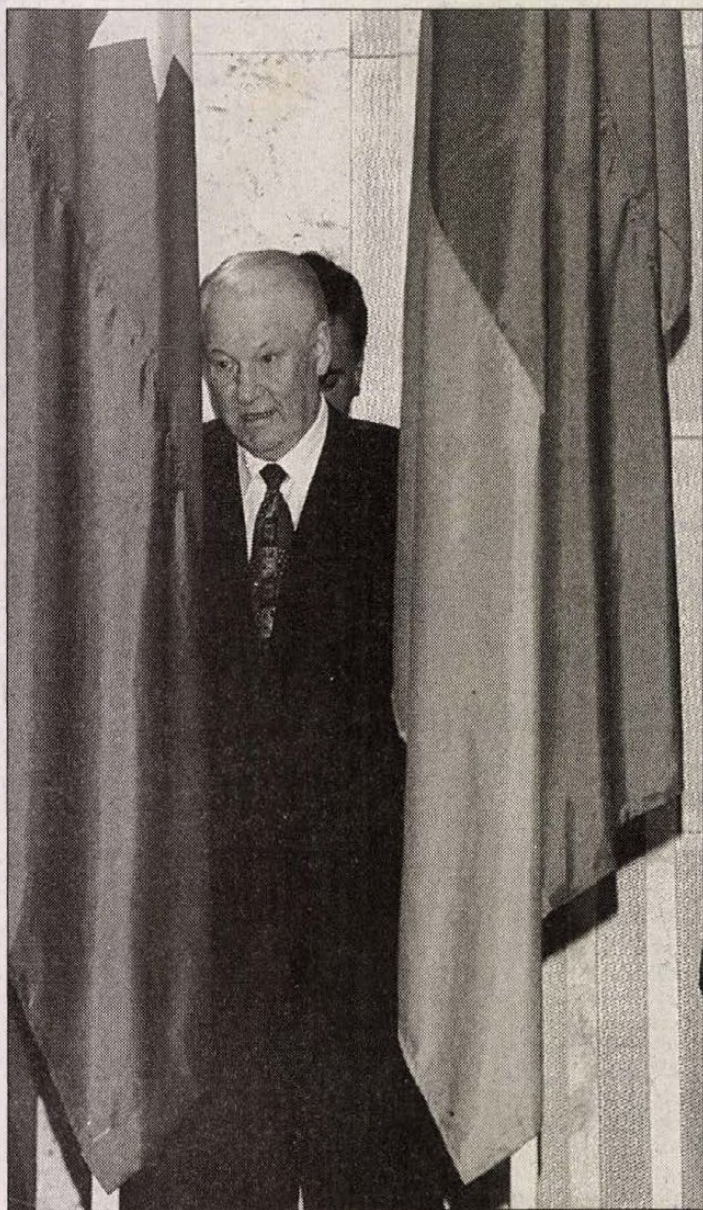
Jelcin orosz elnök a sajtókonferenciára menet

Moszkvában ugyancsak bizalmasan kezelnek egy másik szövegtervezetet, amelyhez azonban hozzájutott az Echo Moszkvi kereskedelmi rádió. Az orosz-fehérorosz államszövetség megalakításáról szóló szerződést Jelcin és Lukasenko esetleg már a jövő héten aláírhatja – annak ellenére, hogy sem a kormány, sem a törvényhozás nem vitatta meg és a sajtó elől is eltitkolták. (Minszk... folytatás a 2. oldalon)