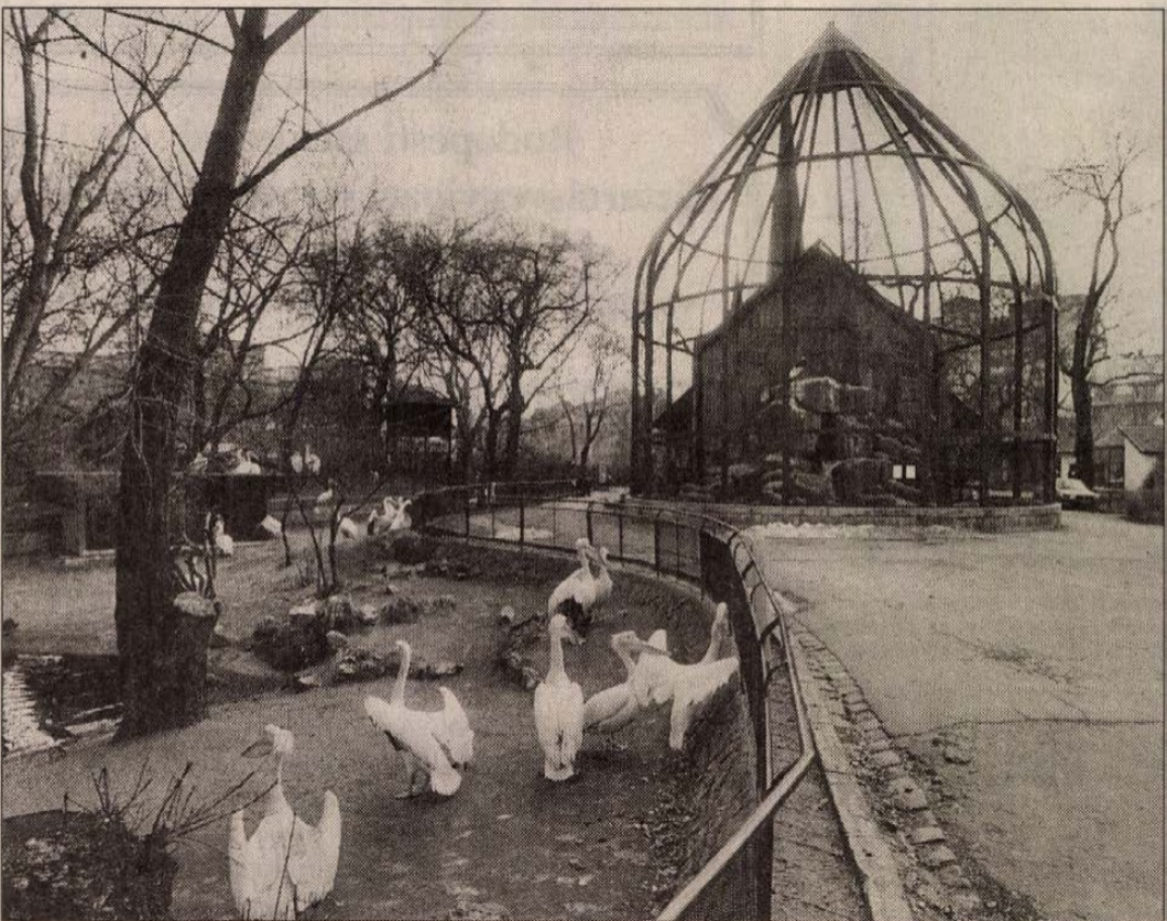
Budapesten a Zoóban csak mutatóban maradnak állatok