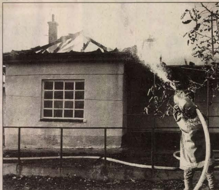
Ehhez az érdi családiházhoz már későn érkeztek