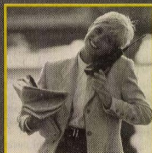
Csak egy hívás!

Egy nagyobb összegre lenne szüksége céljai eléréséhez?