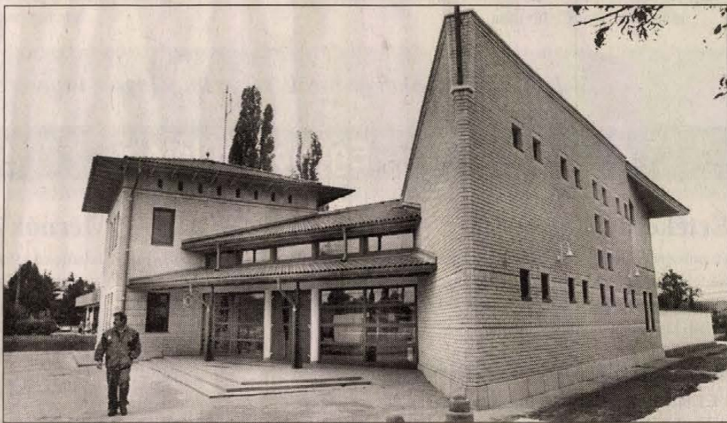
Az épület alkalmazkodik a helyi építészeti hagyományokhoz