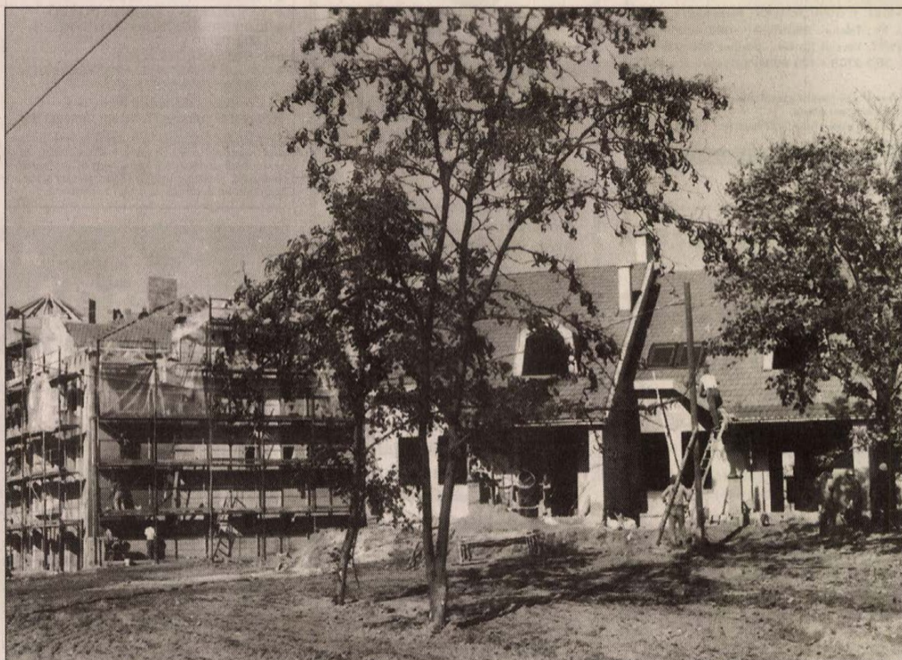
A telephez vezető utat az önkormányzat aszfaltoztatja majd