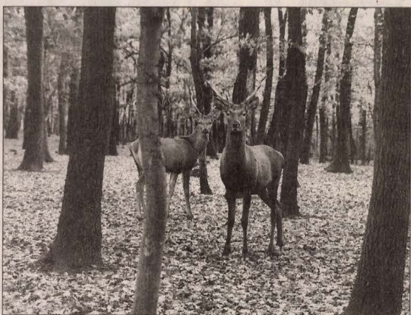
Minden második fa százéves múlt

A fák intenzívebb kitermelése az elmúlt évtizedek gazdálkodása miatt szükséges, a kilencvenes évekig ugyanis alig-alig nyúltak az erdőkhöz, s nem is olyan régen legfeljebb hat-hétezer köbméter fát vágtak ki évente. A lábán hagyott idősebb, nagyobb lombosú egyedek ma már sok helyen akadályozzák a csemefék növekedését. Ez is közrejátszik abban, hogy minden második fa százéves is elmúlt. Érezhetően megváltozott az állomány összetétele is: a tölgy és a cser kárára több száz hektáron a könnyebben szaporodó fajok – például a juhar és a kőris – telepedtek meg a budai oldalon.