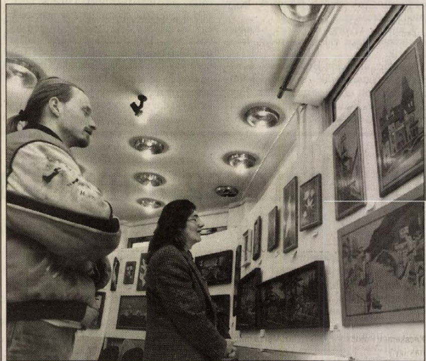
Térbeli és időbeli kirándulásra csábít a tárlat

Nemcsak a térben, az időben is kirándulni visz Ács Ferenc. Dombormű mutat Soproni utcarészletet, egy sikátor darabját házak szögleteivel és régi utcaképekkel; sehol egy emberalak. Sopronban járva egy kicsit a történelemben járunk. A középkor elevenedik meg a Gótika című domborművön is. Hívós templombelsőbe kukucskálunk, akárha