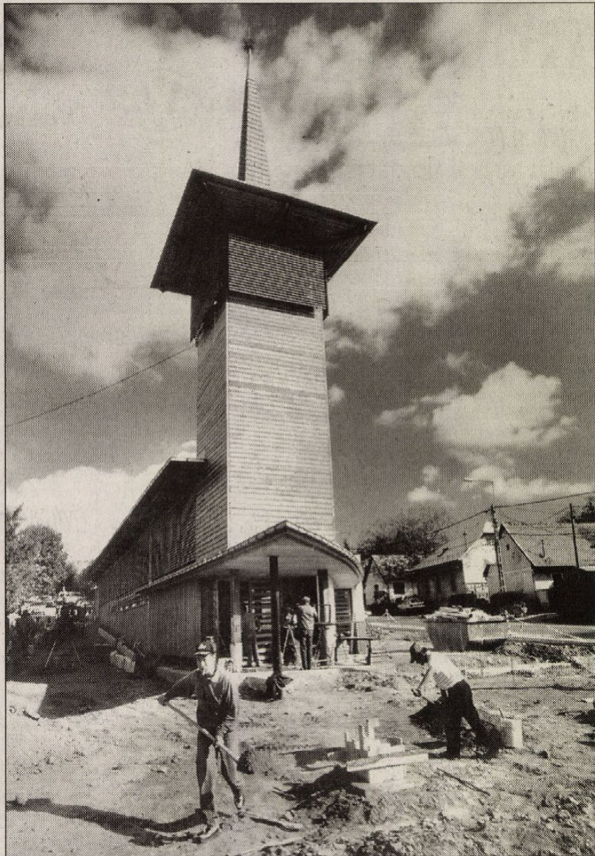
Vakolatlanul szebb volt