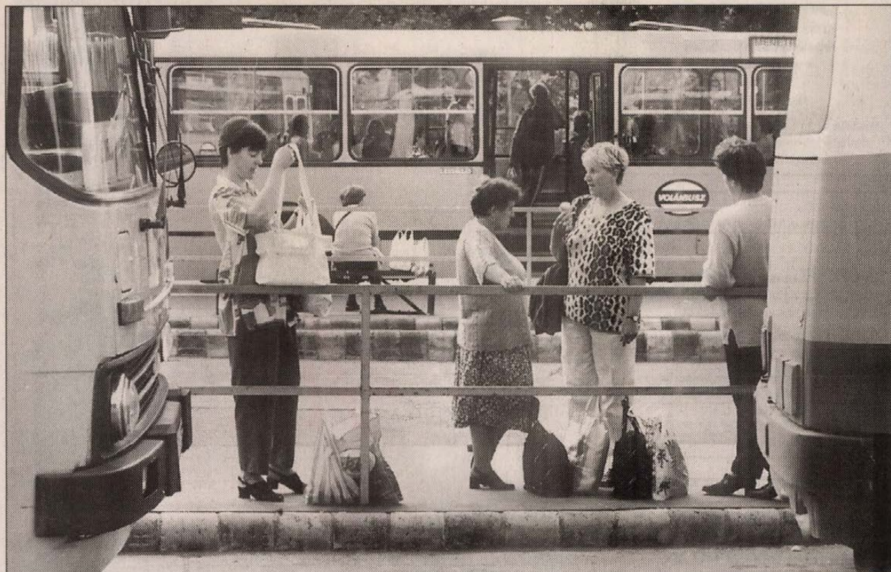
A Volánbusz sűríti a pihenőövezetekbe tartó járatait