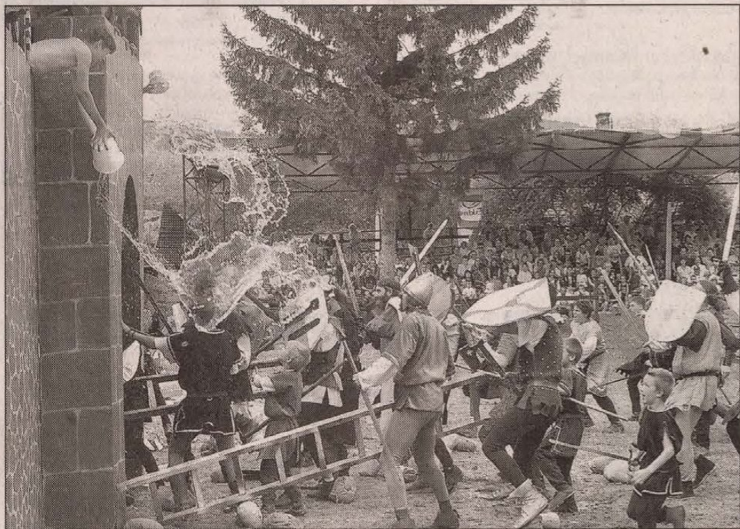
Ostrom és bajvívás

Palotajátékok lovagi tornával, Toldi-vetélkedővel és fogyasztóvédelmi felügyelőkkel