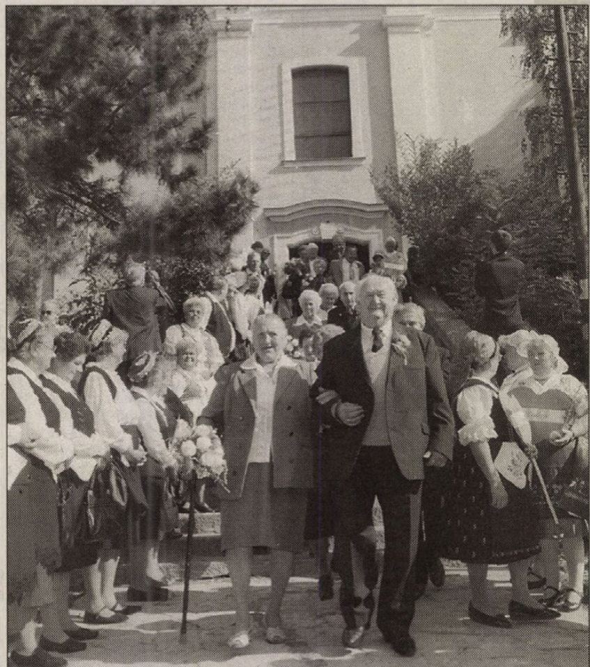
Budakeszi látta vendégül az ünneplő párokat