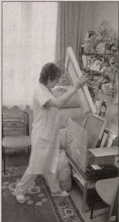
A Koltóiban már pakolnak

Csütörtökön ugyanis igent mondott a fővárosi önkormányzat egészségügyi és sportbizottsága a csepeli Weiss Manfréd Kórház átalakítási terveire. A döntés értelmében a sebészeti és traumatológiai osztályok a továbbiakban összevonva működhetnek, az eddigi nyolcvan ágy helyett összesen hatvan ágyon, az intenzív részleg pedig ebbe az osztályba integrálódhat. A szülészeti és nőgyógyászati osztály ötven helyett negyven ágyval, a belgyógyászat száz helyett nyolcvannal működhet tovább, a jelenlegi krónikus és rehabilitációs osztály