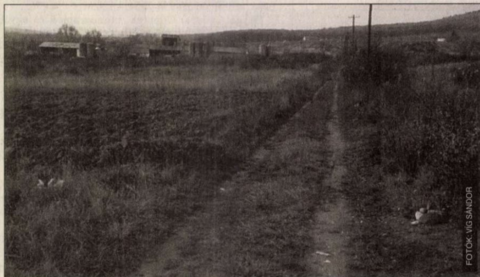
A jelzőkarók még a nyolcméteres utat mutatják

A lakossági fórumon azért is volt parázs a hangulat, mert kiderült, hogy miközben a budakesziek arról tudtak: valamilyen megoldást találnak a kárpótlási ügyeik alapján nekik járó álomföldre, kiderült, hogy a polgármesteri hivatal vezetői már élénk tárgyalásokat, mi több, különböző megállapodásokat is kötöttek a luxuslakópark megépítésére. Miközben a törvény értelmében ez a természetvédelmi területnek számító földrészt egyszázalékos beépíthetőségű lehet, addig már szabadidőközponttá nyilvánítva tízszeres lékossá vált. Még korábban úgy tudták, hogy a Duna-Ipoly Nemzeti Park felügyelete alá tartozik, kiderült, hogy már nem. Hírét vették különböző zárt ajtó mögött folytatott egyezségekre is, ahol nem tudni, hogy hány milliós alkukról született elvi megállapodás. Tény, hogy ez a lakópark hihetetlenül mesés jövedelem eredményez valakiknek, mivel már ma is több milliárd forintnyi értékesítési árról beszélnek. Ezzel szemben a budakesziek szerint bagóért adják oda nemcsak a kárpótlási földalapról elvett részeket, hanem az önkormányzat által hitelből vásárolandó újabb 60 hektárnyi