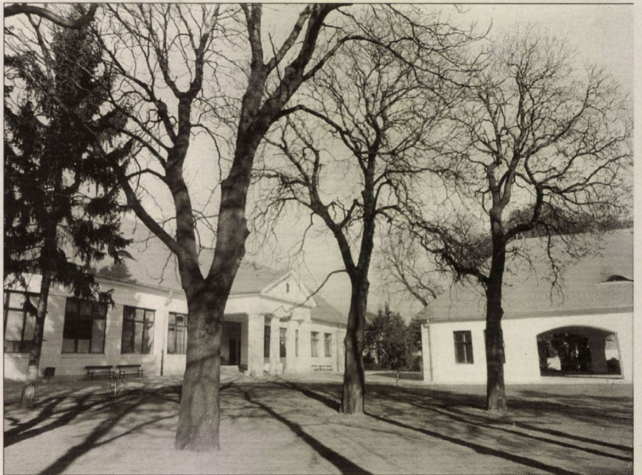
A Magyar Földrajzi Múzeum kívülről is látványos épülete