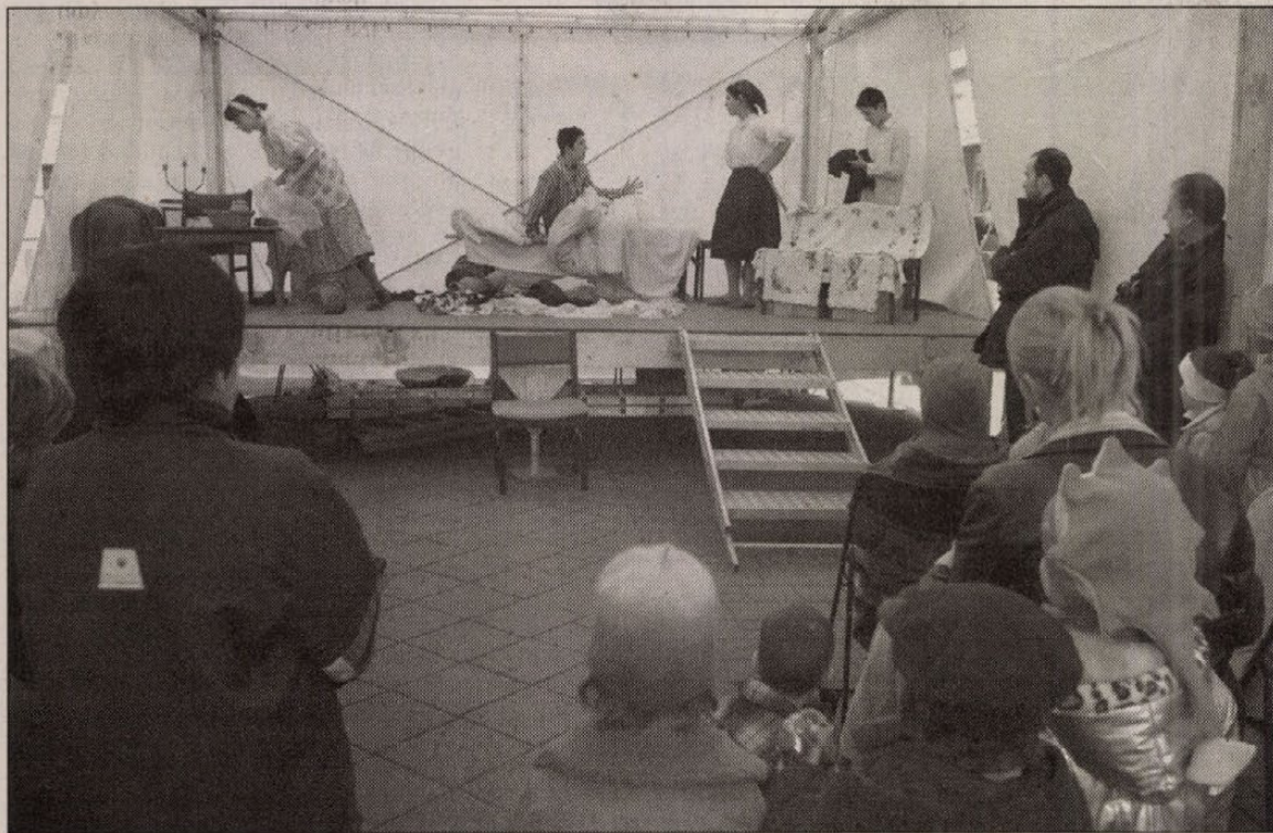
Diák színjátszók szórakoztatták a könyvfesztiválra érkezőket, a főszerep azonban a köteteknek jutott

Könyvek, libasült, kugler és marcipánrózsa a költészet napi fesztiválon