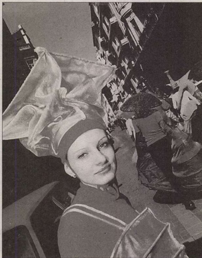
Akció a tavalyi fesztiválon

Péntek délutántól szinte óránként nyílnak a kiállítások. Részben a művészeti eseményeknek egyre gyakrabban helyt adó Ráday utca galériáiban, kulturális intézményeiben, részben olyan nem hagyományos kiállítóterekben, mint az itt