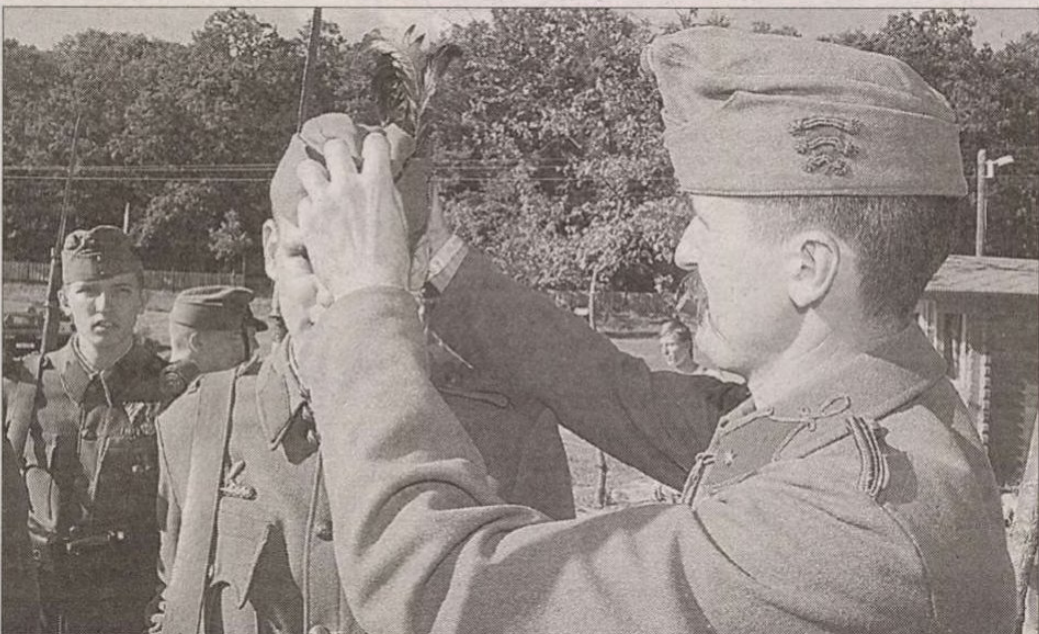
A Honvéd Hagományörző Egyesület soproni tagozata

sebb szakértőjét persze aligha kell bárkinnek bemutatni. Siklósi András Keresztrefeszített Magyarország című előadása is a legizgalmasabb programok közt szerepel. Az egyre karakteresebb, költőibb dalokkal jelentkező nemzeti rockzenét idén olyanok képviselik, mint a Stratégia, a Romantikus Erőszak, az Egészséges Fejbőr vagy a Magozott Cseszernye. A kisgyermekes családokra is gondoltak. 14 év alatt ingyenes a belépés. A kicsiket óvónokkal, tanító-nőekkel gyermekcsarok várja. A nap mint nap több százakkal gyarapodó közönség láttán ezen a nyáron már sokadszorra kell elgondolkodnia a dunakanyariakkal azon, hogy ideje lenne megoldani az északi közlekedést a pompás helyszínek és a főváros között.