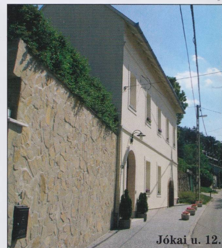
Jókai u. 12.