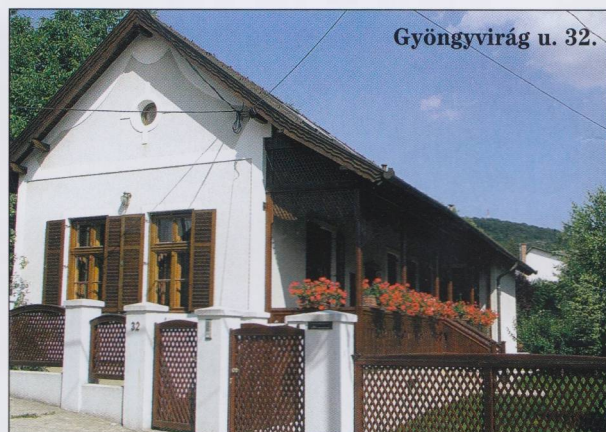
Gyöngyvirág u. 32.

„Helyileg védett épület. Kisbirtokos ház volt. Felújítását a XIX. sz. végén szokásos alaprajzi elrendezés megtartásával végezték. Korhű nyílászárók beépítése mellett visszaállították a tornác faragott fakorlátját és a tornácot árnyékoló faszervezetet. Az egész épü-