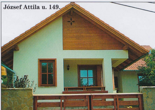
József Attila u. 149.

(„Szép házat, szebb hazát!” – cikk a 12. oldalon)