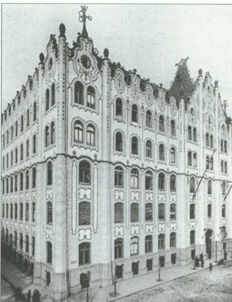
A Lechner Ödön által tervezett Postatakarékpénztár épülete Budapesten, a Hold utcában, 1902-ben. Ide költözik majd az államkincstár