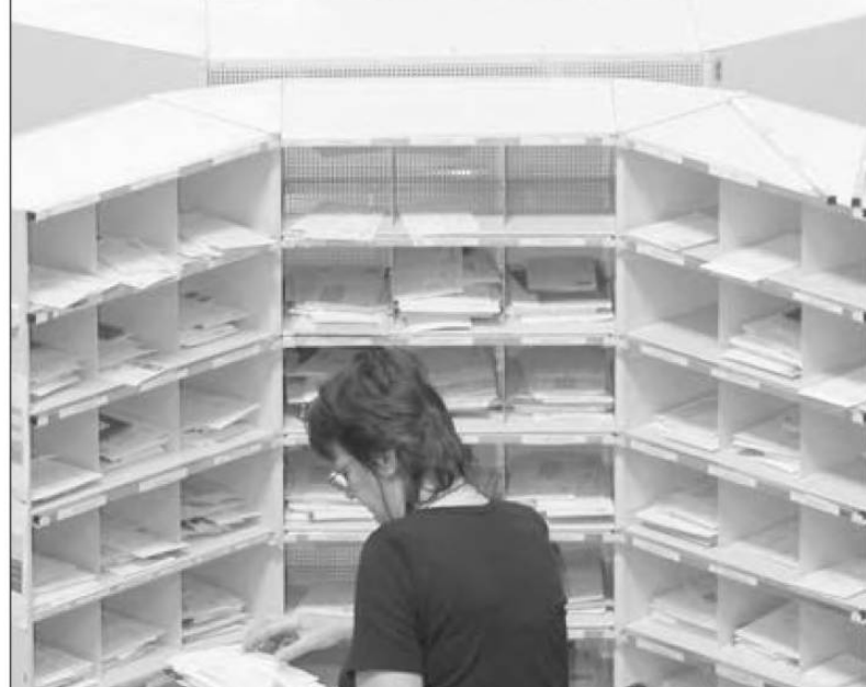
A szolgáltatás szabad áramlását nem korlátozzák a régi tagállamok