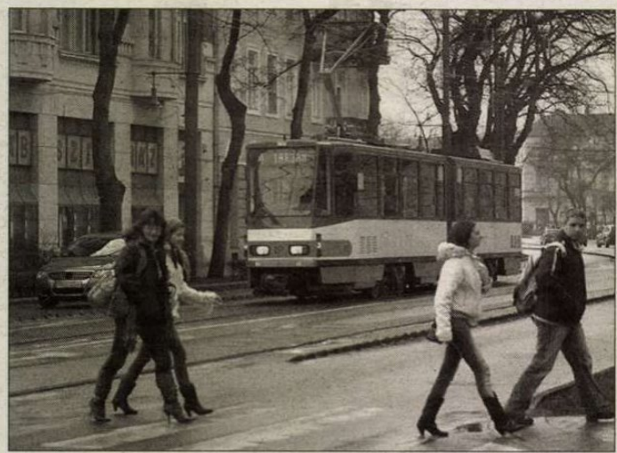
A villamosok közlekedésén már alig lehet változtatni