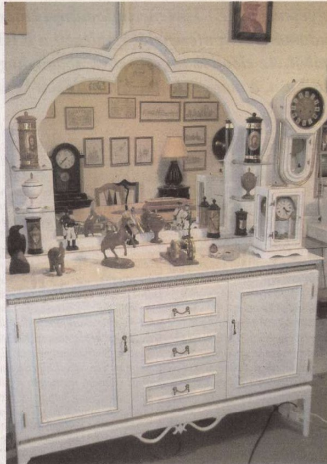
A Bernáth-féle tükrösszekrény

verőlegényei érkeztek, a filmekben pedig a maffiózók. Láttam a különleges rendszámot, de az sem nyugtatott meg. A sofőr bemutatkozott és megkért, ha tehetem, most azonnal üljek be mellé, mert a nagykövet úr szeretne velem beszélni. A napokban érkezett Magyarországra és át szeretné rendezni a rezidenciáját. Az sem baj, ha munkásruhában jövök. A tiszteletet megad-