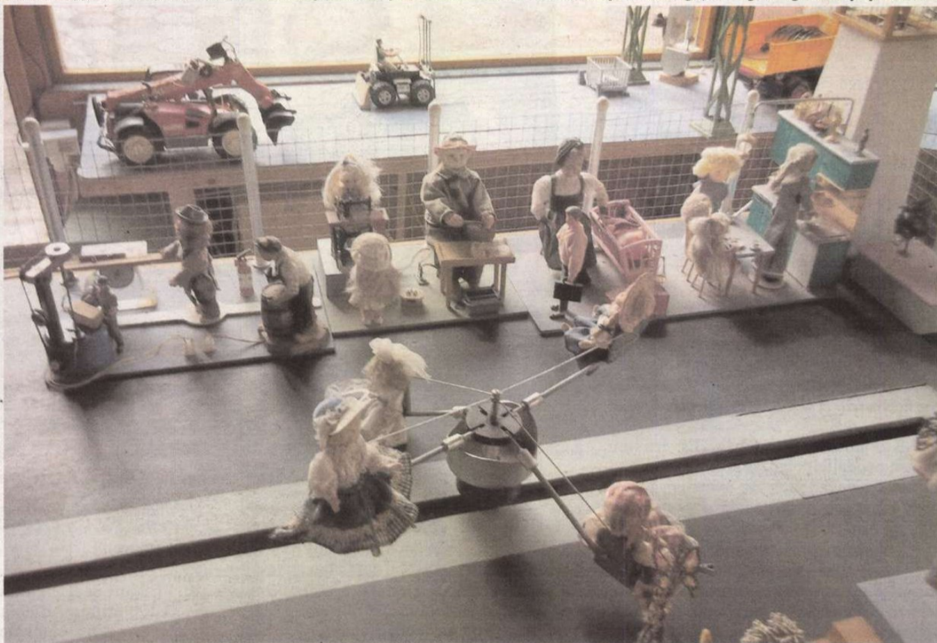
A játékházban majdnem 100 db 3-4-6-12 voltos motor működteti a maketteket, figurákat

– A betegségem. Egyszerűen egy idő után se fizikailag, se idegileg nem bírtam a megterhelést. Ezért úgy döntöttem, abbahagyom vállalkozásomat és csak könnyebb munkákat végzek el, pl. elektronikai, fémesztergálást. A padlásomon sok nemes faanyag maradt meg, sajnáltam azokat eltűzteni, ezért 2006-ban gondoltam, hogy olyan bútorokat készítek, amelyeket a mai erősen szennyezett levegőjű világban igen könnyű tisztán