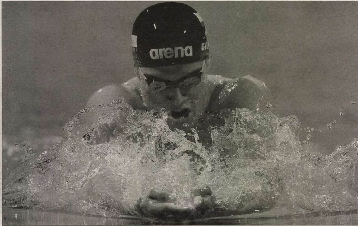
Gyurta Dániel 2009 óta megingathatatlanul ül a 200 méteres mellúszás trónján

Londoni olimpiai bajnokaink többsége nem nyerte meg idei világversenyét