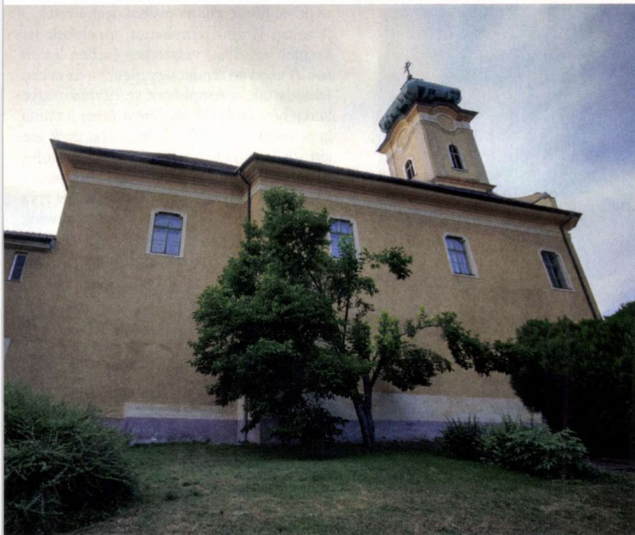
A makkosmáriai kegytemplom

Varázslatos hangulat, a természet csendje és a megpróbáltatások közepette soha el nem bukó hit bizonyága: augusztus 27-étől 29-ig minden este különleges színházi élményben lehet része azoknak, akik ellátogatnak a makkosmáriai kegytemplom kertjébe, Varga Lóránt Kővel, kő nélkül című előadására.