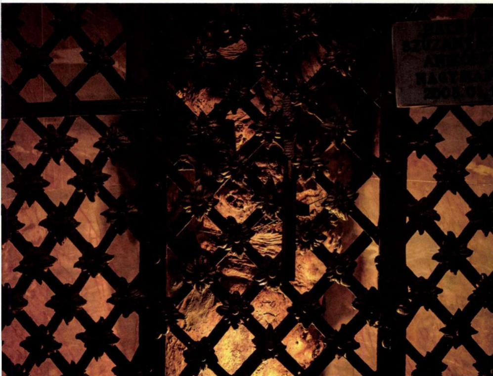
A hagyomány szerint ezen a tölgyfán jelent meg Krisztus arca