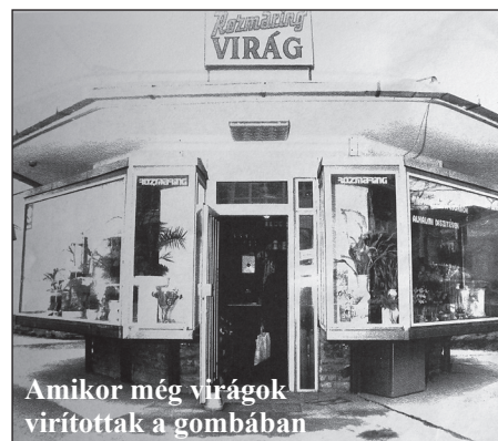
Amikor még virágok virítottak a gombában

nagyhirű s -múltú Budakeszi Szépítő Egyesület újraélesztése és újra megalakítása is az ön nevéhez fűződik.