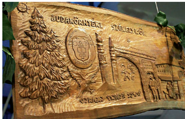
A jubileumi faragvány 2015-ben készült

Az egyesület szeretné a továbbiakban is megtartani és erősíteni a közösségük egybetartó erejét, a Buda környékén élő székelység összetartását, képviselést, hagyományai ápolását és a kapcsolat tartását a szülőfölddel.