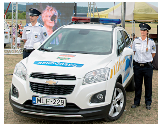
Járőrautót adtunk át a rendőrségnek

Önkormányzatunk a lakossági igényeket szem előtt tartva újragondolta az avar és kerti hulladék égetésének szabályozását. Egészségünk és környezetünk megóvásának védelmében 2019-től ta-