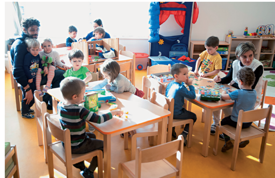
Új csoportszoba a Pitypang Sport Óvodában

2014-ben 165 millió Ft támogatásból 103 milliós önrésszel épült meg a 48 férőhelyes, 4 csoportszobás Mosolyvár Bölcsőde, melyet idén 177 millió Ft-os pályázati támogatásból és 112 milliós önrészből további 4 csoportszobával bővítettünk. A fejlesztéssel további 48 gyermeket tudunk az intézménybe felvenni, új munkahelyek biztosítása mellett. 2016-ban két csoportszobával bővítettük a Pitypang Sport Óvodát, melynek köszönhetően 50 fővel több gyermek járhat az intézménybe. A fejlesztésre 50 millió Ft uniós támogatást nyertünk 17 millió önrész biztosítása mellett. Ebben az évben szintén pályázati finanszírozással, 8,3 millió Ft értékben bővítettük az óvoda eszközparkját is. 36 millió Ft-ot nyertünk önrész biztosítása nélkül a Budakeszi Bölcsőde energetikai felújítására. Idén július 15-én megkezdődtek a mun-