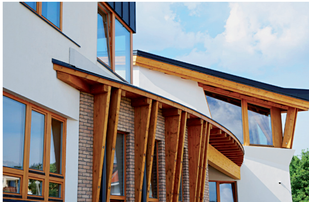
Az új iskolaépület az Árpád fejedelem téren