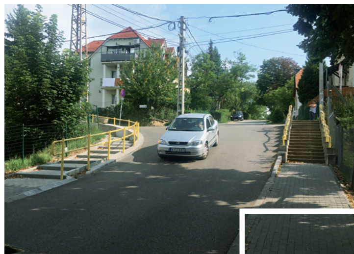
A megújult Szél-Munkácsy utca csomópontja

Okos zebrát létesítettünk a polgármesteri hivatal előtt a Generali a Biztonsáért Alapítvány pályázatán nyert 2 millió Ft-ból.