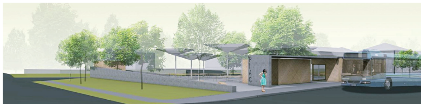
A Dózsa téri piac látványterve

Az önkormányzat fontosnak tartja, hogy kikérje a lakosság véleményét, javaslatát akár a településszintű vagy akár egy-egy utcát, vagy településrészt