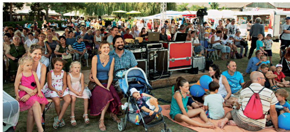
Családi Nap Fesztivál