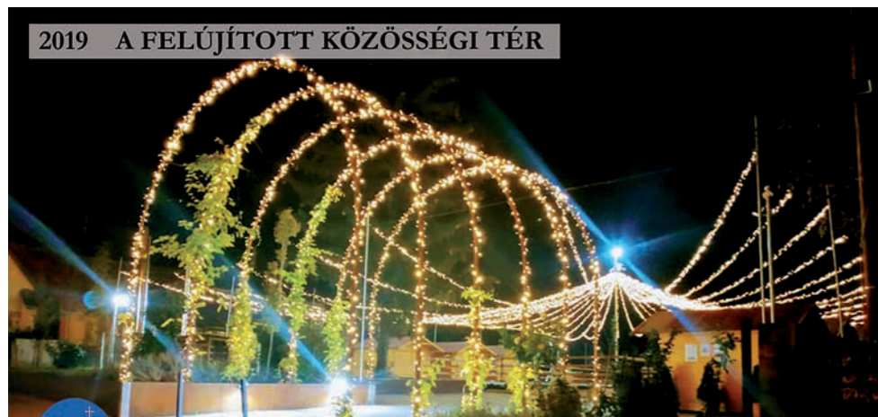
2019 A FELÚJÍTOTT KÖZÖSSÉGI TÉR

Kiadja: Budakeszi Város Önkormányzata.