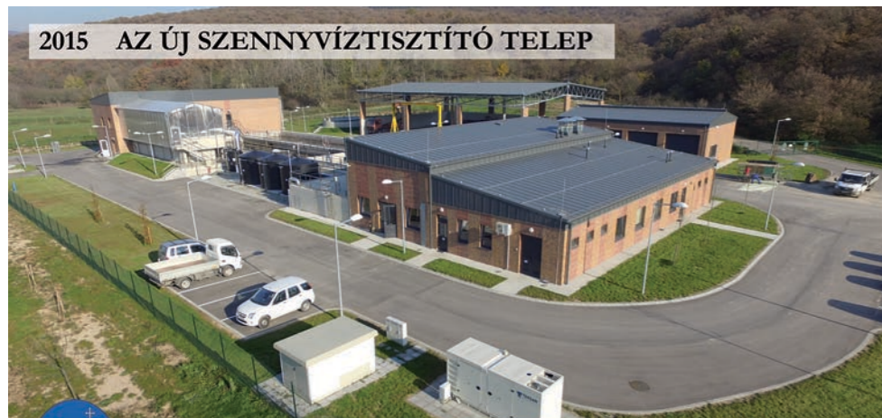
2015 AZ ÚJ SZENNYVÍZTISZTÍTÓ TELEP