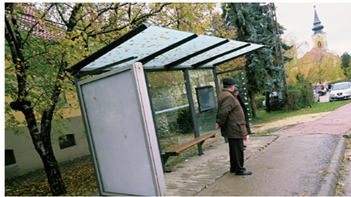
Megújult a buszváró a Városháza megállóban

Városunk és a régió közlekedési gondjainak megoldása mindannyiunk közös érdeke, mely kizárólag térségi és kormányati együttműködéssel érhető el. A kormány évek óta dolgozik az M0-ás autópályát északi és nyugati szektora megépítésének előkészítésén, mely részlegesen segíti majd az agglomeráció közlekedési helyzetét. Megoldást jelenthet a Budakeszi elkerülő út megépítése is. Levélben fordultunk az Innovációs és Technológiai Minisztériumhoz annak érdekében, hogy az elkerülő út tanulmányterve és környezetvédelmi engedélyezési tervének elkészítése az M0-ás