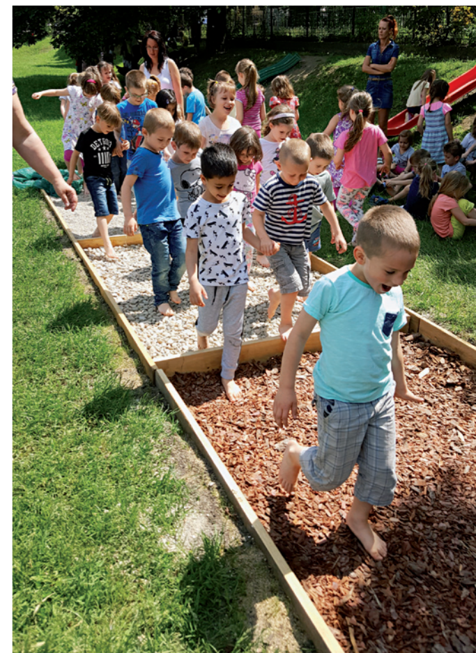
Meztálas ösvény a Meggyes utcai játszótéren

2018-ban 2,5 millió Ft-os pályázati forrásból felújítottuk a I. világháborús hadisírokat és emlékműveket. A tájházon 2 millió Ft-ból kicseréltük a homlokzati nyílászárókat és átalakítottuk a homlokzatot. Elektromos töltőoszlopot telepítettünk a Fő téri parkolóban. Korlátot építettünk a temetőben és a Darányi városrészben, a Reviczky utca tetjén vízelvezető rácsot telepítettünk. A zeneiskolánál lebontottuk a támfalat és lépcsőt alakítottunk ki. Az Idősbarát önkormányzati díjjal járó 1 millió Ft-ból tíz köztéri padot vásároltunk és elhelyeztük a város különböző pontjain. Az orvosi rendelőnél kis játszótér telepítettünk, a Meggyes utcai játszótér körbekerítettük. Kialakítottuk az Árpád fejedelem téri iskola csapadékvíz-elvezetését. 2,5 millió Ft-ból kicseréltük a Szivárvány Óvoda szennyvízrendszerét és az átemelő szivattyút.