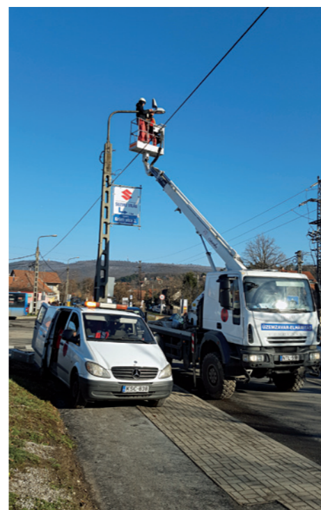
Dózsa téri gyalogátkelő közvilágítás-fejlesztése

rökör, Gerinc, Avar, Öv, Széchenyi utca és Budaörsi út szervizútja.