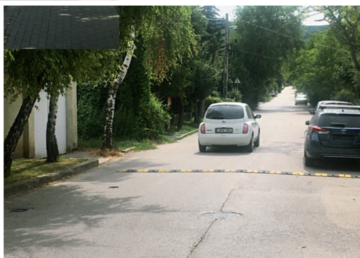
Fekvőrendőr a József Attila utcában

ulnak hozzá az önkormányzat által megvalósított fejlesztéshez. 2014 óta 6387 négyzetméteren újítottunk meg járdát a pályázat keretében 201 helyi ingatlan előtt 49,3 millió Ft-os önkormányzati támogatással.