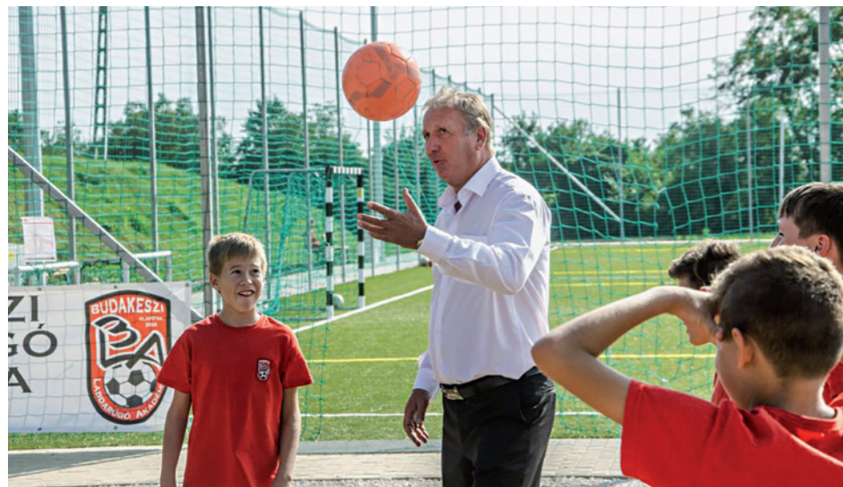
Az új műfüves sportpálya

Az önkormányzat 2014-ben az Értékes vagy! uniós projektje keretében többek között számos sikeres éjszakai pingpong bajnokságot szervezett. A megnövekedett igények kielégítése érdekében az önkormányzat részvételével a helyi lakosok 2015-ben megalapították a Budakeszi Amatőr Asztalitenisz Egyesületet. A szervezet azóta is sikeresen működik, rendszeresen szerveznek pingpong bajnokságokat is. Az egyesület augusztus végén utánpótlást nevelő szakosztállyá alakult és várja a környéken élő tehetséges fiatalok jelentkezését.