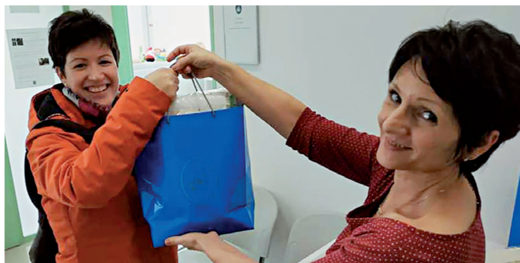
Babacsomaggal köszöntjük a családokat

2014 óta megújítottuk, bővítettük az intézményeinket. Új bölcsődét, iskolát és szennyvíztisztító telepet építettünk a városunkban. Továbbá négy, majd 2016-ban két csoportszobával bővítettük a Pitypang Sport Óvodát. 2018-ban a korábbi hat helyett tíz rendelőt alakítottunk