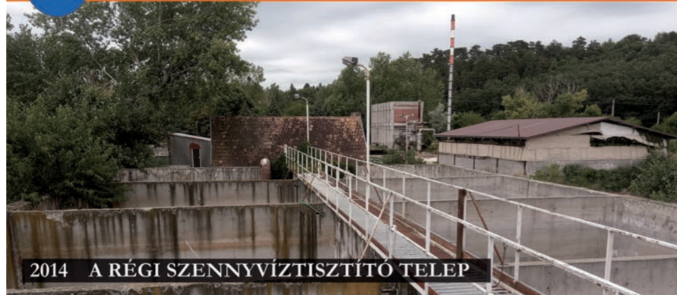
2014 A RÉGI SZENNYVÍZTISZTÍTÓ TELEP