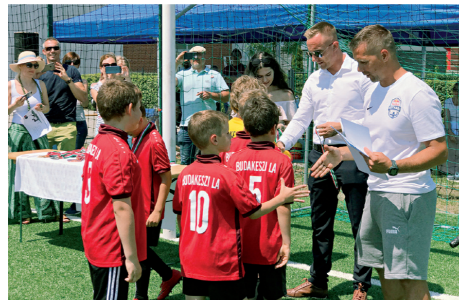
Focikupa az egészségprogram keretében

A 12 település alkotta Budakörnyéki Önkormányzati Társulás (BÖT), melynek elnöki feladatait Budakeszi látja el, 2018 májusában együttműködési megállapodást kötött az Országos Korányi Pulmonológiai Intézettel a Budakörnyéki Egészség Program megvalósítására. A program komoly hangsúlyt fektet a dohányzás visszaszorítására, az egészséges táplálkozás és az örömteli testmozgás támogatására. Ennek keretében számos rendezvény (kihívás napja, egészségnap), iskolai sportverseny (pingpong, foci), iskolai komplex egészségfelmérés és a társulás településeiről összesen 28 pedagógus képzése is megvalósult. A BÖT 2019. január 21-én vette használatba a hordozható érintőképernyős számítógépet, mely a gyermekek dohányzásra való rázkódásának megelőzését szolgálja. A számítógép a társulás minden településének minden általános iskolájába eljut – elsőként a budakeszi Széchenyi István Általános Iskolába -, ezzel is segítve, hogy a gyerekek elutasítsák a dohányzást és a nem dohányzó életmódot válasszák.