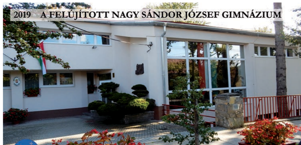
2019 A FELÚJÍTOTT NAGY SÁNDOR JÓZSEF GIMNÁZIUM

Ezúton is köszönjük a fejlesztésekkel járó átmeneti kellemetlenségek során tanúsított türelmüket, és hálásak vagyunk azért a sok biztatásért, mely nap mint nap erőt ad munkánkhoz. Bízom benne, hogy az Önök támogatásával a jövőben is szolgálhatom városunkat.