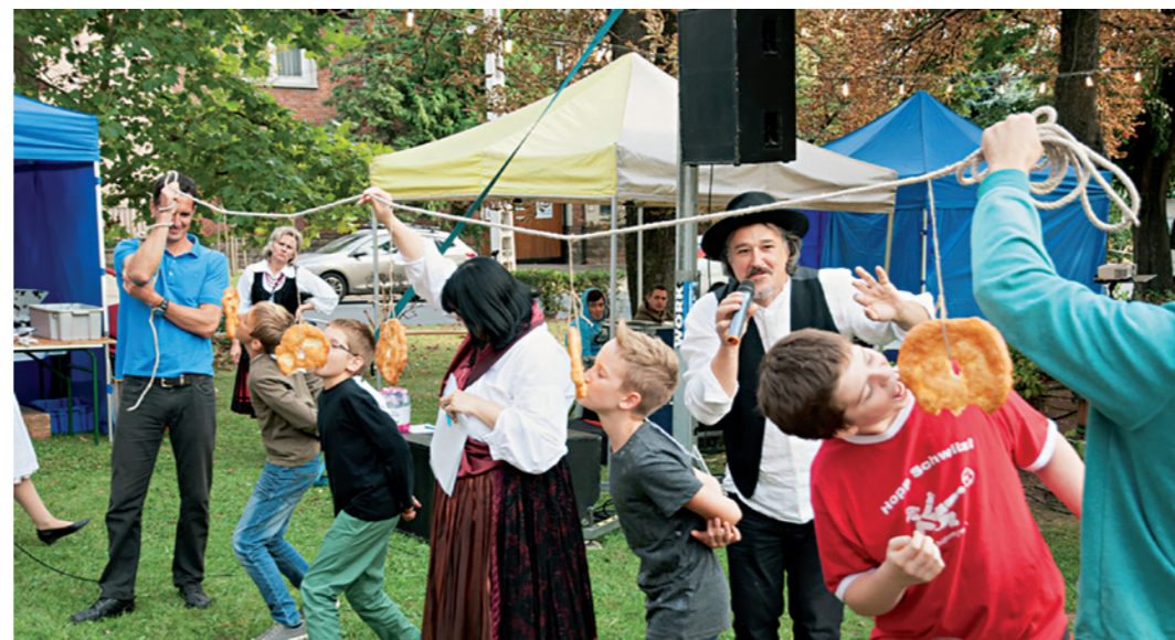
Mihály napi vigasság

Csaknem 2 millió Ft-ot nyertünk 2016-ban a Budakeszi helyi értéktár kialakítására. A támogatásból megvalósítottuk a Mezei Mária ház ingóságainak leltározását. A makkosi jelenésekkel kapcsolatos, török időkből származó latin nyelvű iratok kerültek elő az egyházi leltárból, melynek lefordítását is meg tudtuk valósítani a pályázati forrásból. Helyi sváb népszokások gyűjtését, leírását, helyi védett lakóházak és szobrok katalógusának elkészítését, valamint