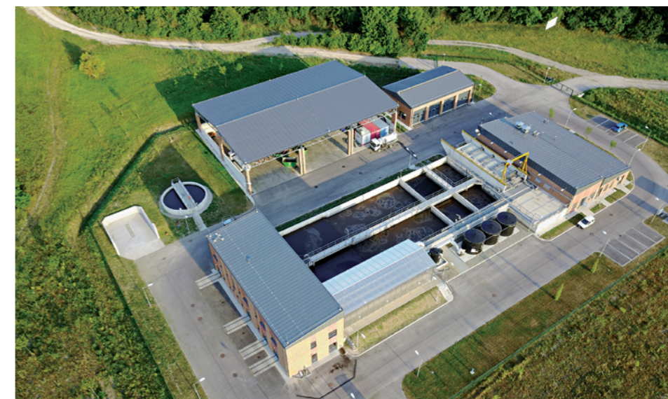
Az új szennyvíztisztító telep

Városunk történetének legnagyobb beruházása a szennyvízprojekt, mely keretében megépült a világviszonylatban is korszerű membrántechnológiával működő szennyvíztisztító. A telep kivitelezésével párhuzamosan a csatornahálózat is kiépült Makkosmárián, továbbá gerincvezetékét építettünk a Meggyes-Munkácsy-Fűzfa-Táncsics utcákban és a Dózsa György téren is. Mindezeket túl – számos lakossági igénynek eleget téve - kiegészítő beruházásként a Gábor Áron, Árnas, Törökvész és Hajnalka utcák, valamint a Makkosi út 3388. hrsz. alatt lévő ingatlan csatornázása is megvalósult. A projekt közel 850 családnál tette lehetővé a szennyvízelvezetést a tisztítótelep és 20,5 kilométer új csatorna megépülésével. A beruházás a csatornázással érintett utak eredeti állapot szerinti helyreállításával fejeződött be. A szennyvíztelepet 2015. szeptember végén adtuk át. A pályázat részeként új út épült