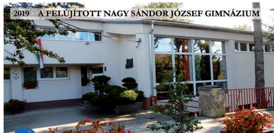
2019 A FELÚJÍTOTT NAGY SÁNDOR JÓZSEF GIMNÁZIUM

Ezúton is köszönjük a fejlesztésekkel járó átmeneti kellemetlenségek során tanúsított türelmüket, és hálásak vagyunk azért a sok biztatásért, mely nap mint nap erőt ad munkánkhoz. Bízom benne, hogy az Önök támogatásával a jövőben is szolgálhatom városunkat.