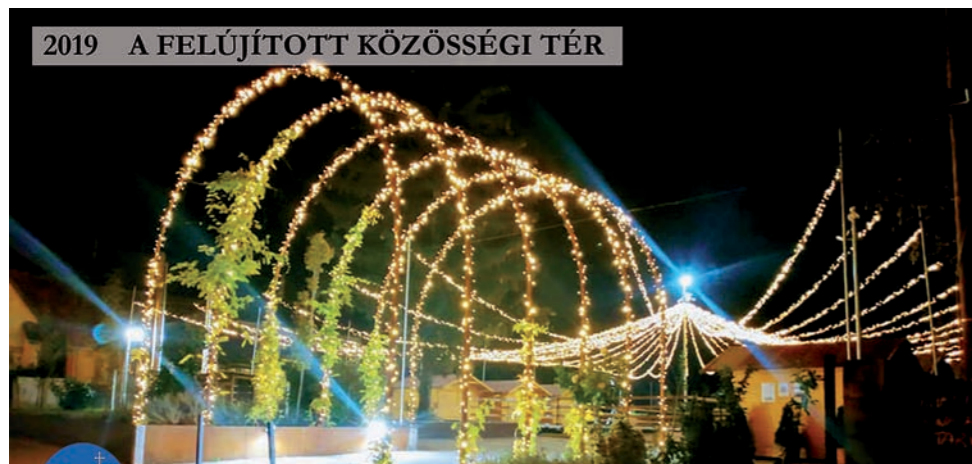
2019 A FELÚJÍTOTT KÖZÖSSÉGI TÉR

Kiadja: Budakeszi Város Önkormányzata.