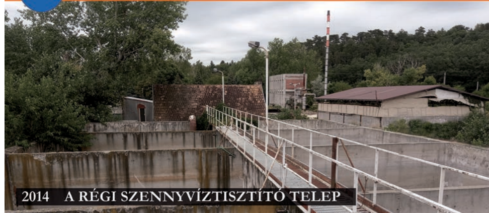
2014 A RÉGI SZENNYVÍZTISZTÍTÓ TELEP