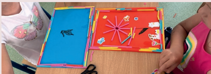
Csak a fantázia szabhat határt