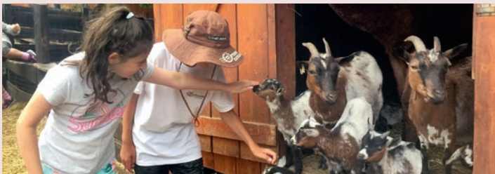
Kecskék, gidák és a többiek...