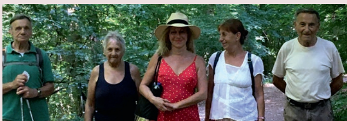
Útban a Csacsi-rétre

Természetesen az idősebb korosztályról sem feledkeztünk meg; heti rendszerességgel szerveztük a sétaturáinkat, ahol kellemes környezetben és társaságban aktív mozgással telt az idő