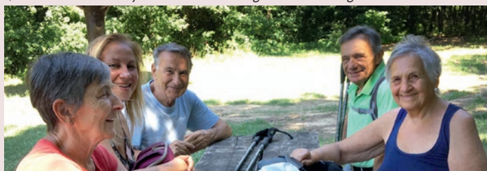
Szilfa tisztási pihenő