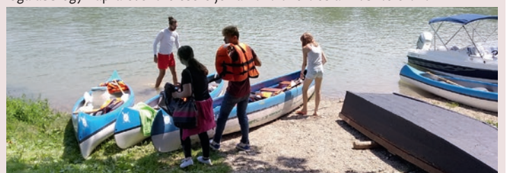
Kikötöttünk a Lupa-szigeten

A Központ utcai és lakótelepi szociális munkásai kütyümentes kenutúrákkal érték el, hogy a kamaszok legalább egy napra evezőre cseréljék a kontrollert és a mobiltelefont