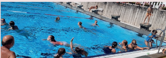
Jajj, úgy élvezem én a strandot!