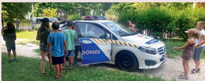
Köszönjük az élményeket a Budaörsi Rendőrkapitányság rendőreinek!