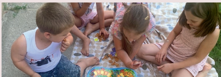
Pihenés az árnyékban