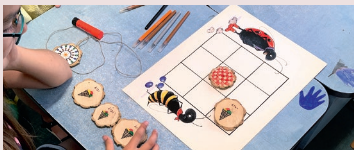
Saját társast alkottunk