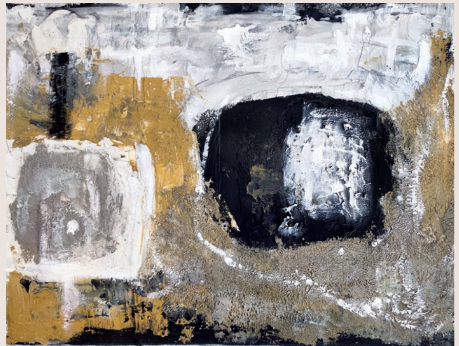
Fehér Irén: Belső terek

Mészöly Zsófia Éva festő-restaurátor olyan festők képeit, vagy azok részleteit dolgozza ki, mint Gentile da Fabriano és Cimabue.