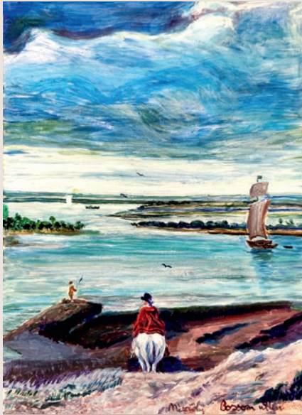
Mészöly Zsófia Éva: Anthoine van Borsom: Folyópart (másolat)

leket idéző kompozícióján a valóságtól elvonatkoztatva geometrikus szabályszerűségeket keres.