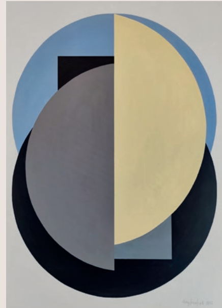
Nagy Imre Gyula: Kompozíció félkörökre

A művésztelep képanyaga egy a közeljövőben megrendezett kiállítá-