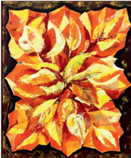
Kósa János: Színharmónia

Vágvölgyi Attila grafikusművész végtelen türelemmel és aprólékos pontozásos technikával tustollal alkotta meg a Tojás-dal című tusrajz kanyargó indáin a fényeket és árnyékokat: a 2001-ben elkezdett munka a tábor ideje alatt nyerte el az utolsó párezer tustinta-pöttyöt. A szellőléptű lány című munkáján a nőalak levegőben hullámozó ruhában szinte súlytalanul, táncolva lép előre.