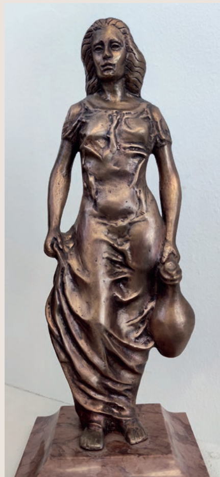
Józsa Lajos: Korsós lány

A terem jobb sarkában lévő, lanton játszó nőalakot formázó saját szobra mellett alkotott Józsa Lajos szobrász-