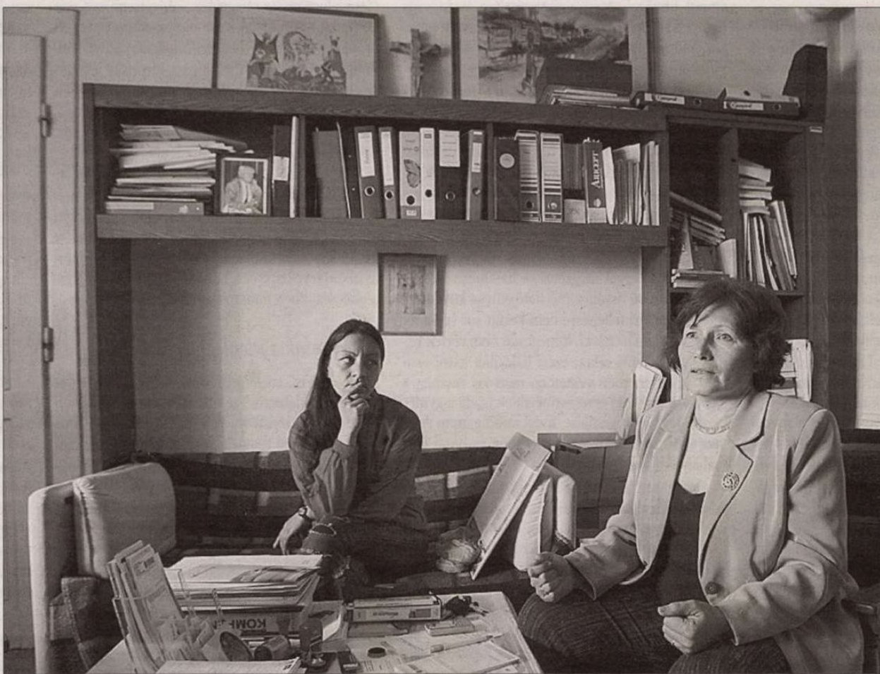
A szenvedélybetegségek gyógyításában az egyén elhatározása döntő szerepet játszik

– A gondozó előterében várakozó há- rom hölgyet felkérve egy közös beszélge- tésre, pszichoterápiás kiscsoportra alaku- lunk – fogalmaz a pszichiáter –, és a ren- delő kanapéval, fotellel, számítógéppel berendezett szobájában mesélni kezdik életüket. (Az érintettek egy fiatal édes-